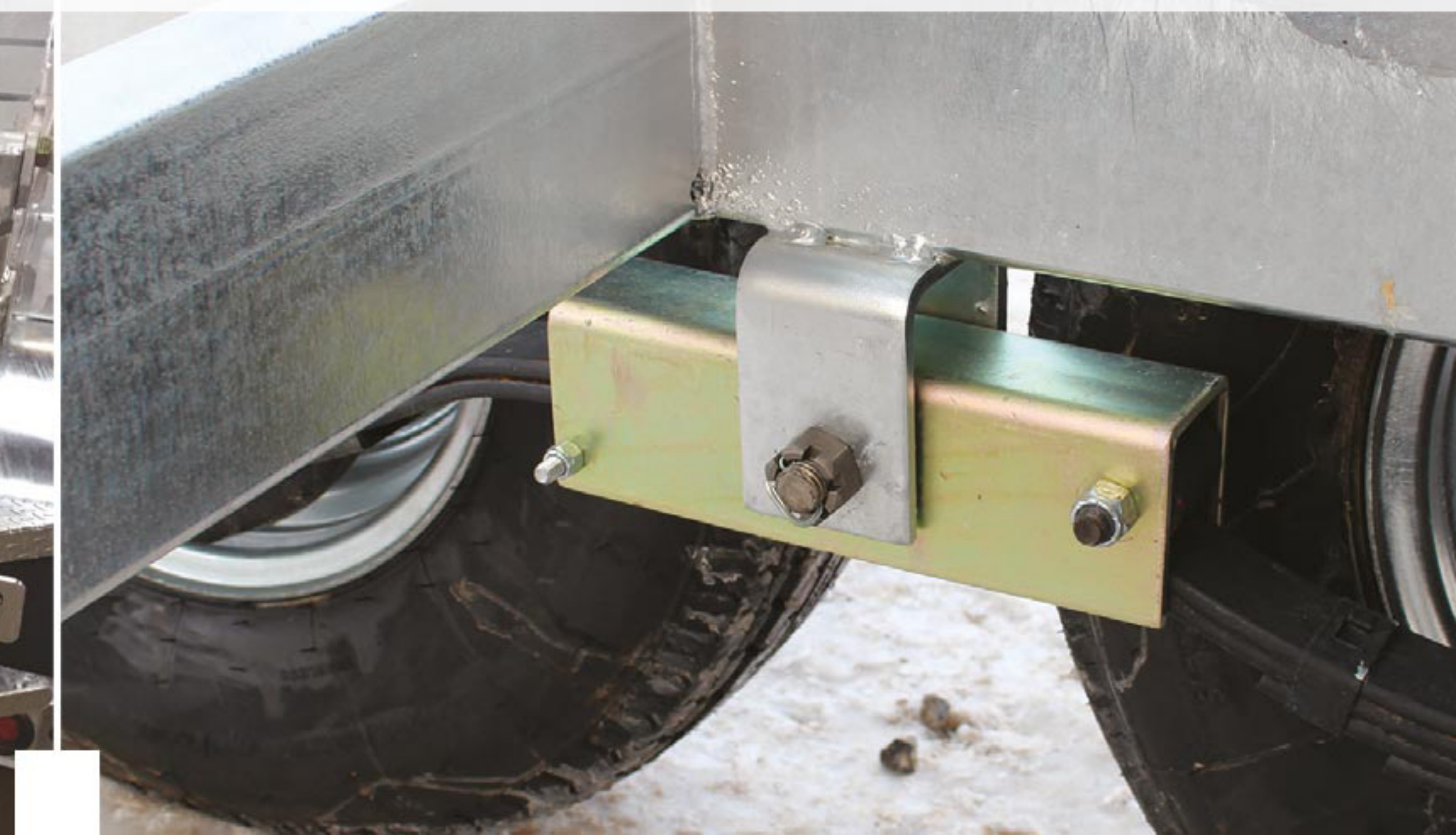
Suspension industrielle à glissière