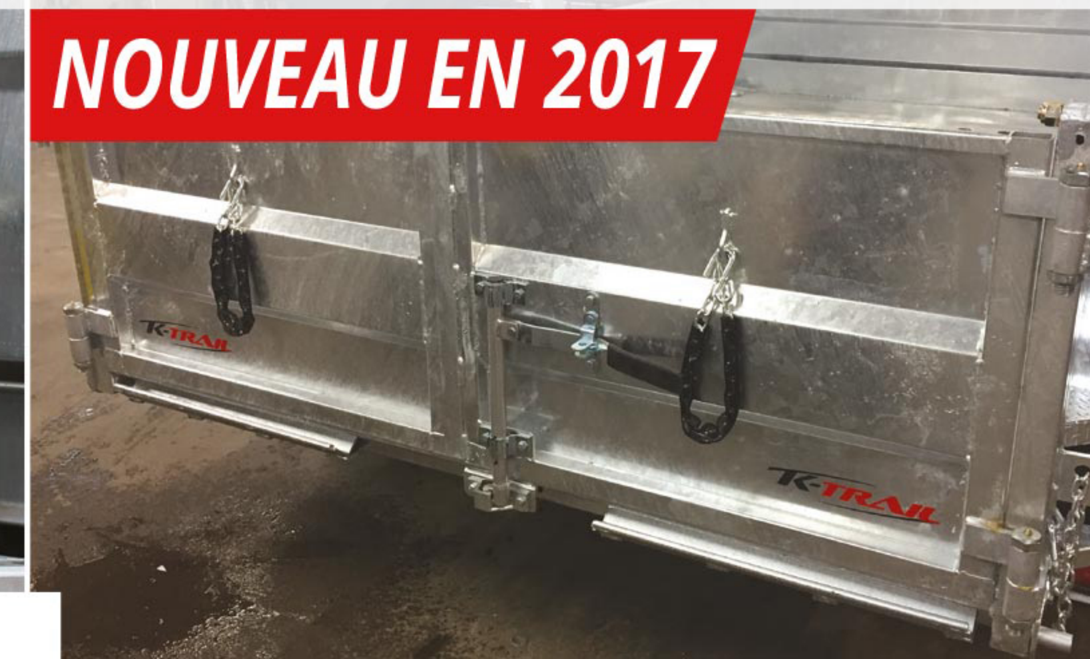
Portes arrières avec pliage pour plus de force